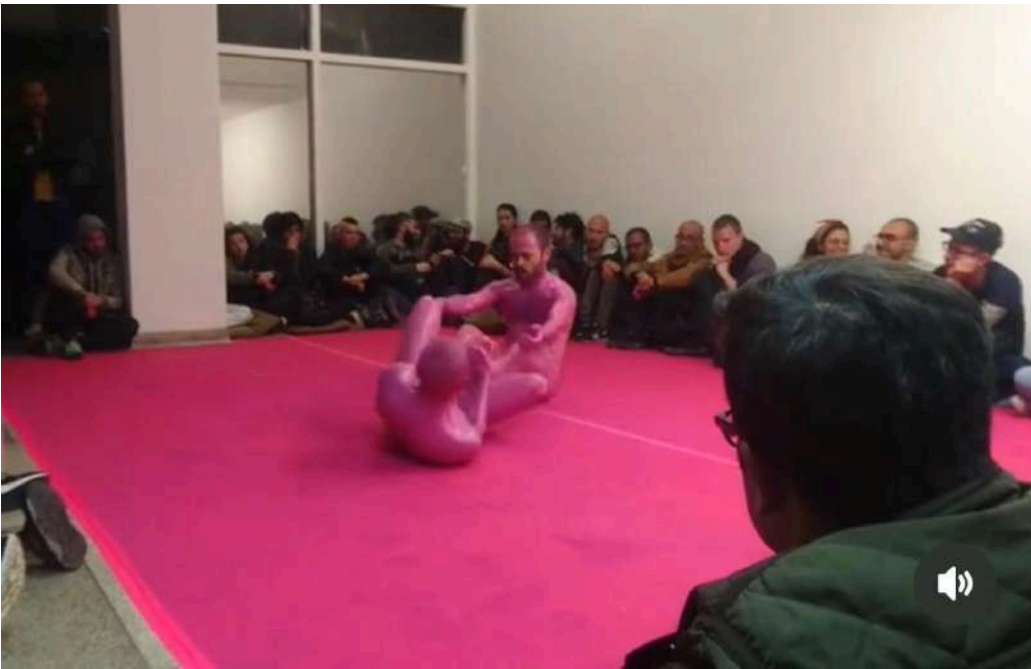
Exposición KUIR BOGOTA 2019 en El Parche Artist Residency.