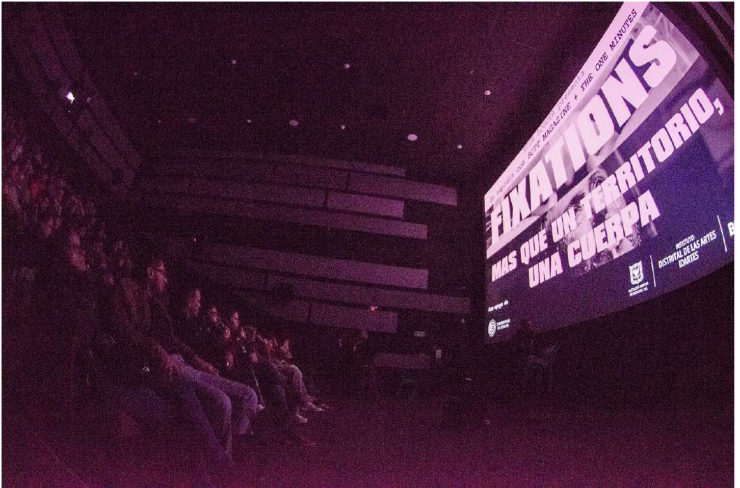
Imagen. Exhibición Selección de cortos KUIR BOGOTA 2024 Cinemateca de Bogotá.