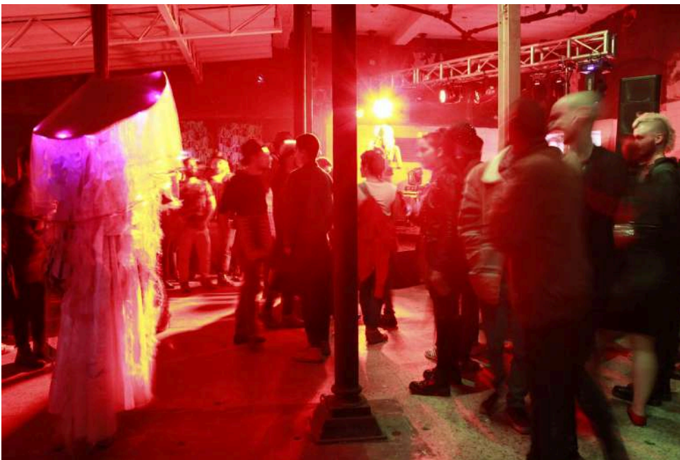
Imagen. Maratón de performance KUIR BOGOTA 2018