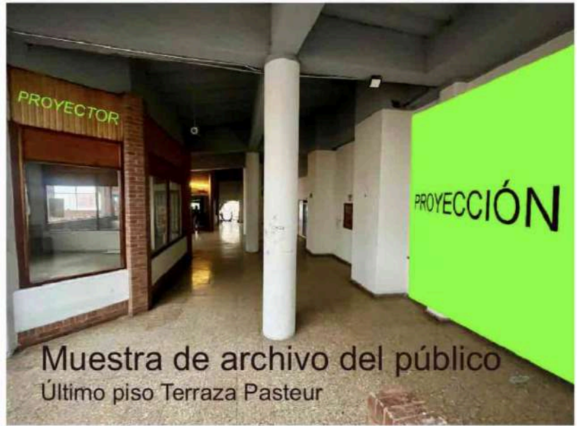
Imagen. Boceto de la propuesta de instalación en Terraza Pasteur