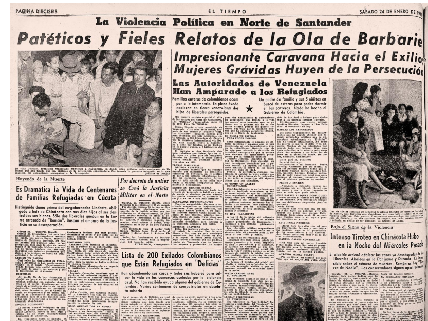
La violencia política en Norte de Santander. «Patéticos y fieles relatos de la ola de barbarie». 24 de enero de 1948. El Tiempo .

Aunque La Violencia fue más extensa como periodo, llegando incluso a 1965, los cuatro años seleccionados fueron decisivos para su propagación e intensificación. Recuérdate que en ese cuatrienio varias decisiones gubernamentales auparon la confrontación bipartidista y otros hechos la aceleraron. Por ejemplo, el Estado de sitio, las gobernaciones militares, la censura a la prensa y las telecomunicaciones, los consejos de guerra, el cierre del Congreso, las asambleas y concejos, el fin de la unión nacional o el cogobierno con los liberales, y claro está, el Bogotazo y sus repercusiones en las regiones.