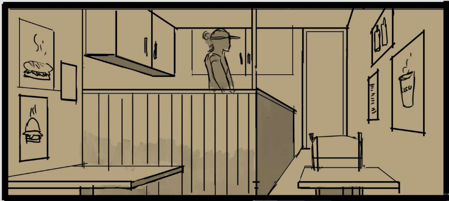
Lugar favorito de mi barrio: restaurante argentino